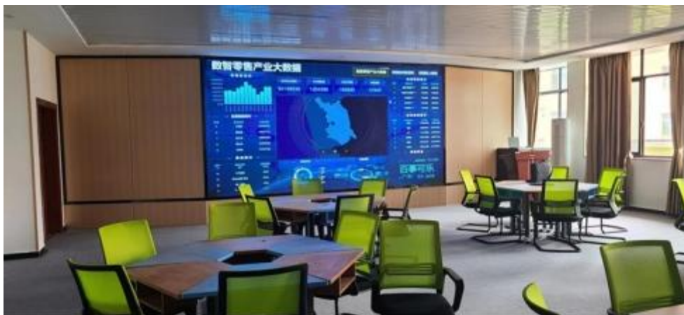
图 2 智慧零售运营中心

智慧零售运营中心代合 319 积 130 方集大分、和创 创 孵化 的 慧 ( 2-3), 包 含 备、 及 等 90.01 ( 表 1)。