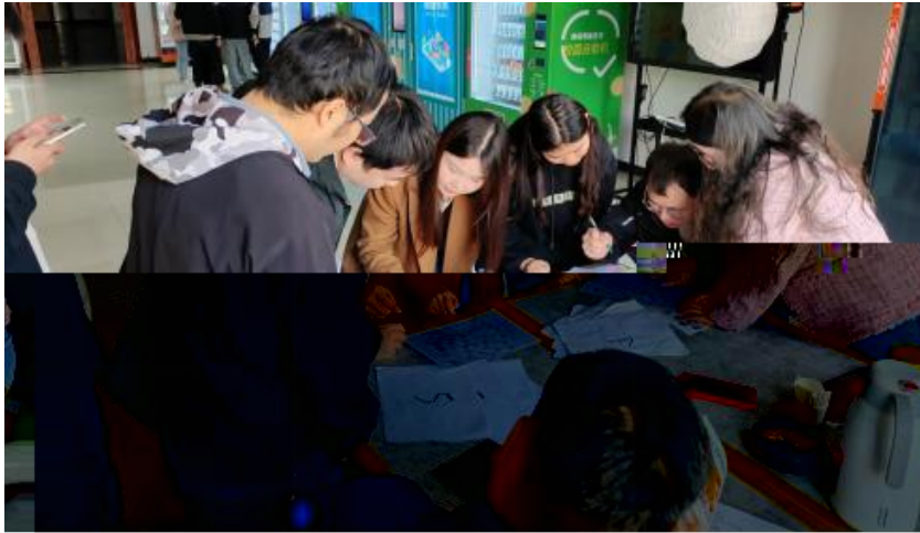
图5 卓越团队建设共识营