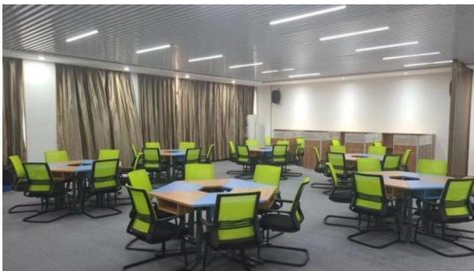
图 3 智慧零售运营中心