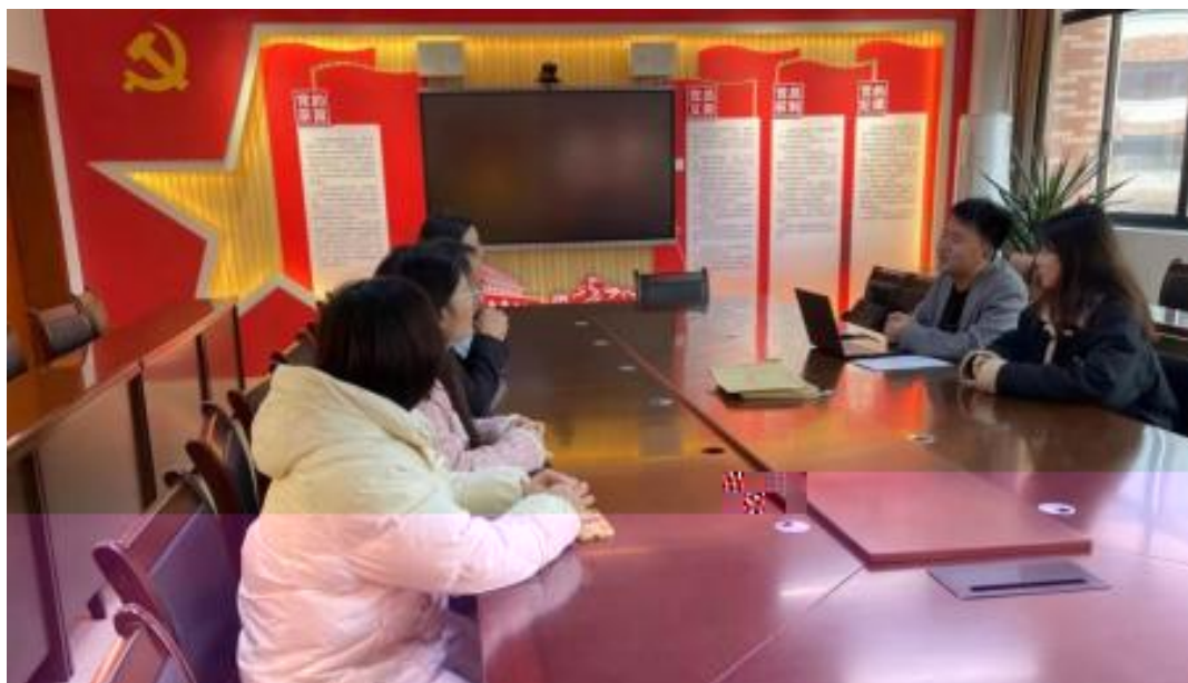
图 1 校企开展学术研讨项目交流会议

公 高度 队的 ，充分 到 和 的关 ，对 高 和 关 的 。此公 供 ，包 更 、 方法 及 导 发 程，并 持 丰富 的 家 过 、 会和 际案 ， 队 分 的 和 。 常 地 活动， 包 参加 会 、 等 ， 促 的 的 分 ， ， 并 的 队 ( 1)。