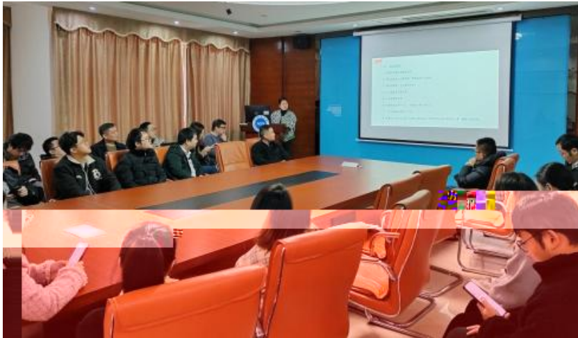
图4 员工专业技能培训

2023 年，公司 促 进 发 展 和 才 方 得 成 功。 通 过 创 新 的 和 不 动 公 司 的 持 续 成 长， 工 供 应 的 发 展 机 会。 通 过 供 多 样 化 的 和 发 展， “ 队 队 共 建 ” 等 活 动 ( 4-5)， 帮 助 工 技 术 和 管 理； 并 通 过 的 和 规 划， 工 的 合 作 和 包 围， 导 发 展 计 划、 技 术 及 部 等， 地 促 进 工 的 方 发 展。