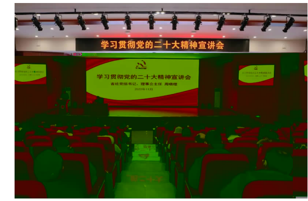
11月30日 省 讲 精神 晓 来 湖南 精

入好 往努 沟通桥梁: 注 呼声 解 困难: 依法 达诉 据悉 2021年 收 案 涉 利 施 均相 部 牵 研 收 案 也将 逐 答 10 案 也将 (通讯 易婧 摄影 欣